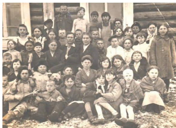
Ученики Едетской начальной школы в 30-е годы.