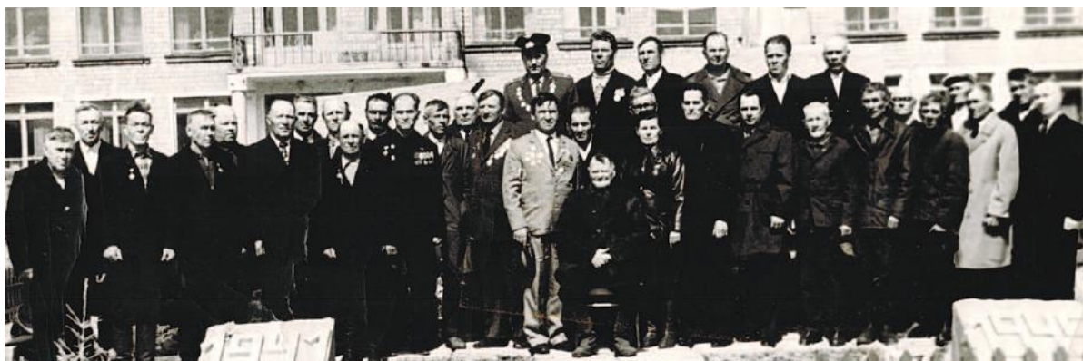
1976 – 1977 гг. Ветераны войны посёлка Инголь и деревни Едет.