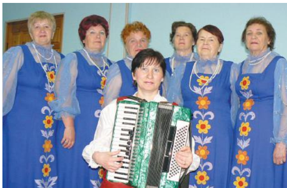
с. Берёзовское. Фестиваль «Играй, гармонь!».