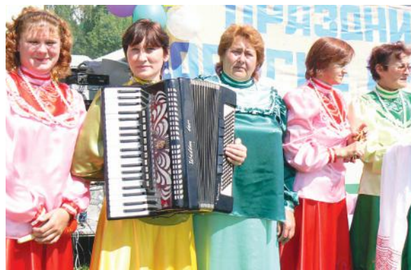
На фестивале «Каратаг» с ивановцами.