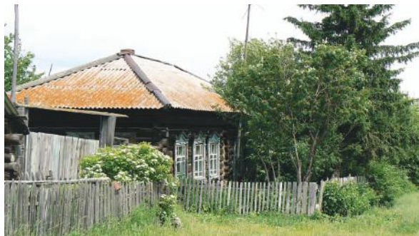
Сельский дом в д. Едет.

Единоличное хозяйство велось до 1930 года. Среди населения уже были бедняки, середняки и богатые. Богатых в селе было немного. Богатыми считали тех, у кого была большая семья из работающих мужиков, в хозяйстве было более двух лошадей, более 3-4 коров, овцы, много земли.