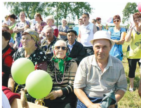
На праздновании 115-летия деревни Едет.

Было в нашем селе и два небольших завода: кирпичный и маслобойный. Продукцией последнего было рыжиковое масло, имеющее ценные питательные вещества. Оно пользовалось большим спросом. Кирпич, выпускаемый в селе, использовали для строительства зерносушилок, кладки печей. Сельчанам выдавалось по 500 штук для возведения печек в домах.