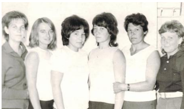
Молодые специалисты ПЧ–33