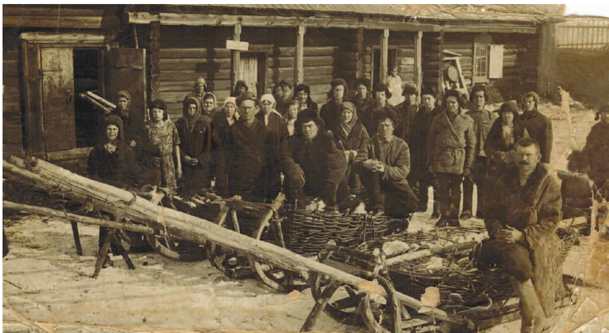
25 октября 1933 г. База колхоза «Первомайский» деревни Едет.

Знаменита история нашего села и революционными событиями. Старейшие жители рассказали много интересного. К примеру, в 1916 году многие крестьяне отказались идти на войну. И только когда уполномоченный из Ачинска прибыл в Едет и побеседовал с жителями, набор состоялся.