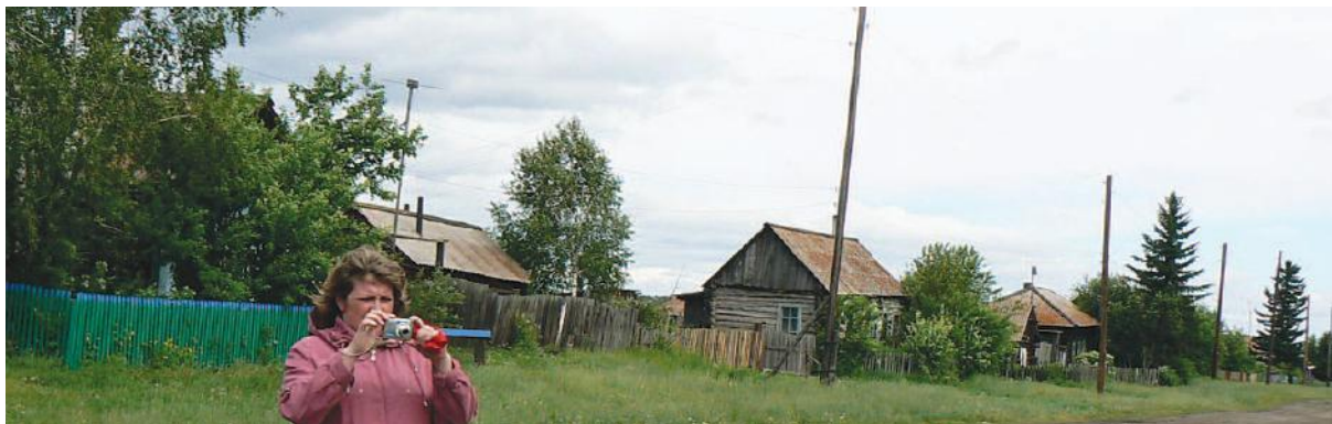
Ул. Щетинкина в Едете.

В 1936 году поступило два колесных трактора ХТЗ. Было целое паломничество, когда встречали трактора, вышли и стар и мал. До войны и во время войны работа тракториста, даже прицепщика были престижными. Трактора работали круглосуточно. Трактористы жили в вагончиках, даже если поля находились рядом с селом. В войну 70 – 80 процентов женщин были трактористами, комбайне-